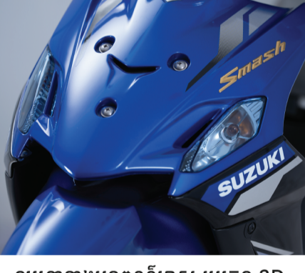
ឡូហ្គោខាងមុខពណ៌មាស ប្រភេទ 3D