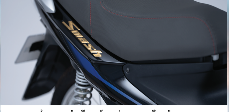
តែមរចនាម៉ូតូថ្មី ពណ៌ស្រស់ស្អាតសមនឹងតួម៉ូតូ