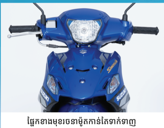
ផ្នែកខាងមុខរចនាម៉ូតូកាន់តែទាក់ទាញ