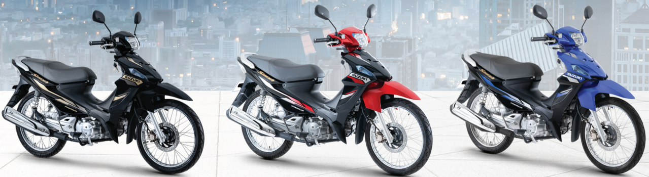
● ពណ៌ខ្មៅ ● ពណ៌ខ្មៅ-ក្រហម ● ពណ៌ខ្មៅ-ខៀវ